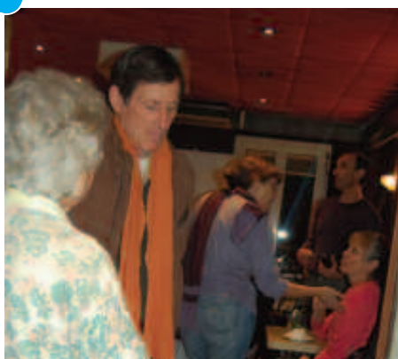
Premier Caf'écolo à l'Aquarelle Café. Discussions et débats animés en prévision du sommet de Copenhague sur les enjeux climatiques.